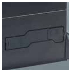
■ Dispositivo de desbloqueo mediante llave personalizada