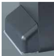
■ Cáster cubretornillos