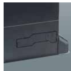
■ Base de aluminio fundido a presión con tratamiento de cataforesis